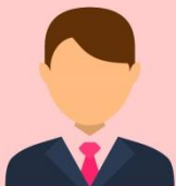
อธิการบดี

ผลการประเมินการปฏิบัติงานขององค์กรกำกับดูแล 11 องค์กรในรูปคณะกรรมการ 11 ชุด มีองค์กรที่ได้รับคะแนนระหว่าง 4.01 – 4.83 อยู่ในระดับ “ดีมาก” ถึง “ดีเยี่ยม” จำนวน 10 องค์กร และองค์กรที่ได้รับคะแนนระหว่าง 3.50 - 3.99 ซึ่งในระดับ “ดี” ถึง “ดีมาก” จำนวน 1 องค์กร